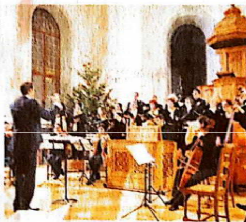
Les orgues rassemblent. Gallay

sociation des Amis des Orgues de Morges et sa Région, ce festival a pour objectif de familiariser un large public avec les musiques de cet instrument. Désireux de se dé-