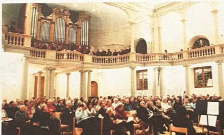
Le festival oscillera entre l'Eglise catholique et le Temple.

«Nous essayons de proposer des concerts de haut niveau,