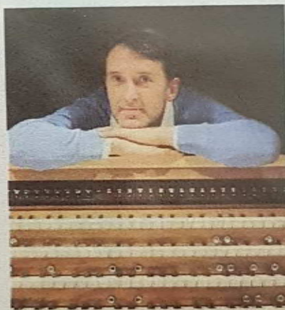
Olivier Latry sera jeudi à Morges.

Olivier Latry, vous avez été nommé en 1985, à l'âge de