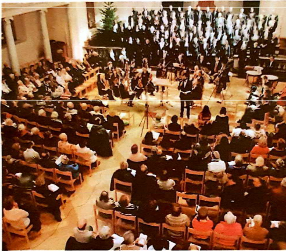
Les cinq prochains dimanches, au temple ou à l'église de Morges, seront consacrés aux concerts d'orgue.

MORGES Pour la septième année consécutive, l'orgue est au cœur de son propre festival.