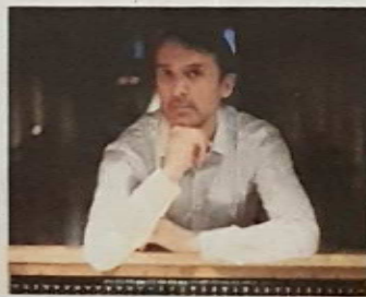
Olivier Latry, organiste.